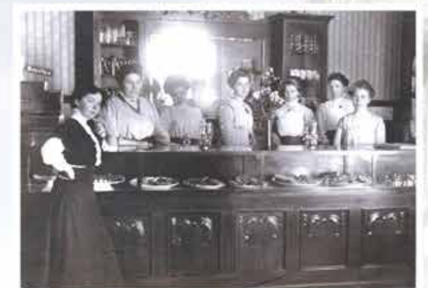
Selskapets medarbeidere i restaurantlokalet tidlig på nittenhundretallet