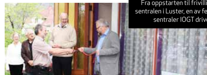
Fra oppstarten til frivilligsentralen i Luster, en av fem sentraler IOGT driver.

Dersom øremerkingen opphører, tror han også at en vil oppleve en massiv nedleggelse av frivilligsentraler. En kommune med knapphet på penger, har lett for å ville prioritere de lovpålagte tjenestene, noe frivilligsentralene ikke er, uten å tenke på hva frivilligsentralene betyr for både den enkelte frivillige og for de som mottar tjenester fra sentralene.