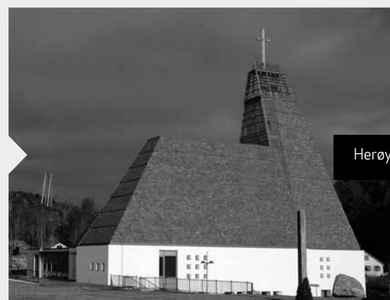
Herøy kirke //